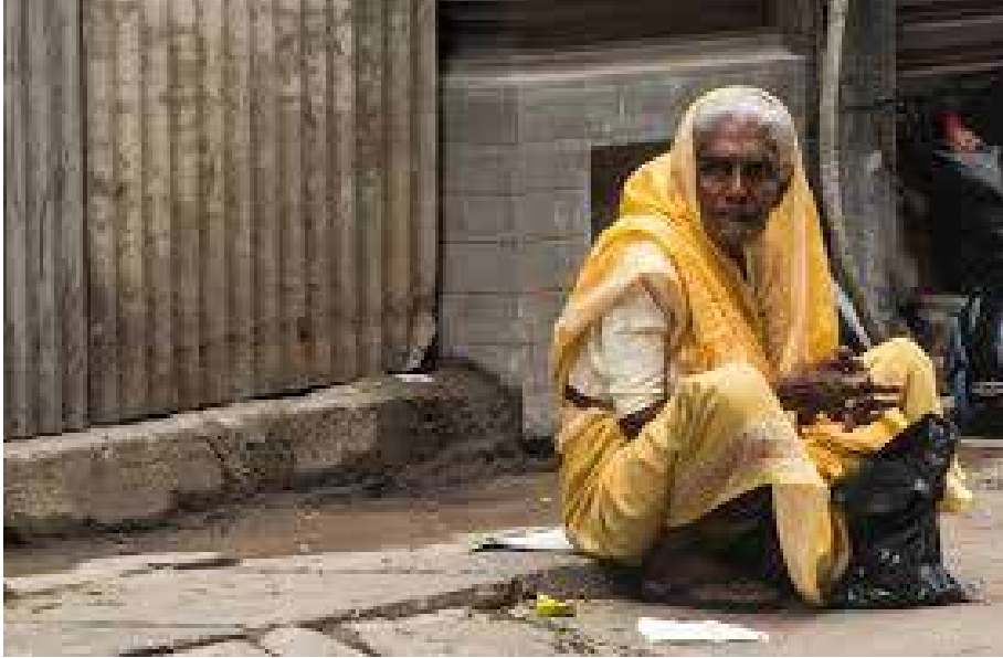
அதில் எனக்கொரு சந்தோஷம்.

எனது தாயார் நான் சிறையில் இருக்கும்போதே இறந்து போனார். ஒருபிடி மண் கூட போடவில்லையே என்னும் கவலையைவிட எனது உழைப்பில் என் தாயாருக்கு ஒரு பருக்கை கூட கிடைக்கவில்லையே என்பதே எனது எப்போதுமான கவலை.