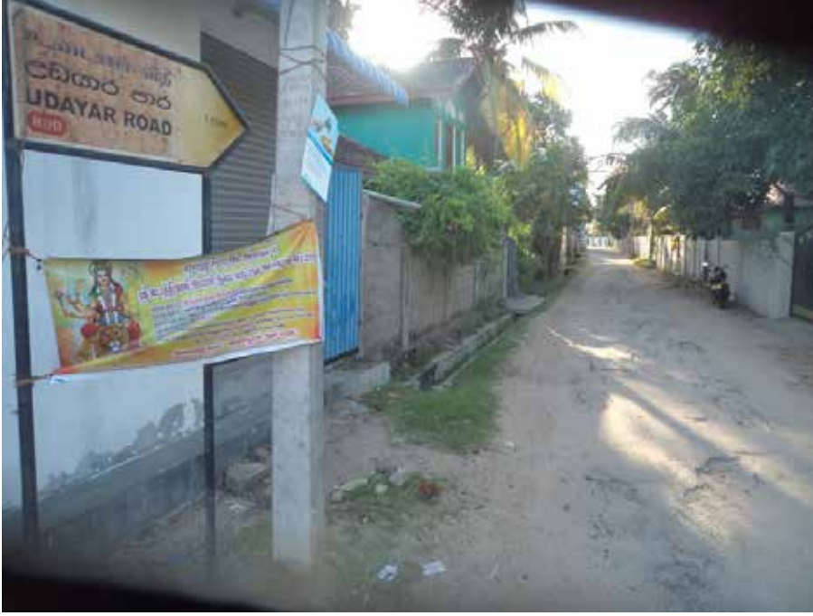
---காரைதீவு நிருபர் சகா--

கல்முனை தமிழ் பிரதேசங்களின் பெரும்பாலான வீதிகள் குண்டும் குழியுமாக போக்குவரத்திற்கு பொருத்தமற்றதாக மாறி வருவதாக மக்கள் புகார் தெரிவிக்கின்றனர்.