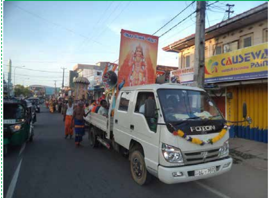
--காரைதீவு நிருபர் சகா--

வரலாற்றுச் சிறப்புமிக்க மண்டூர் முருகன் ஆலய வருடாந்த மகோற்சவத்தையொட்டி காரைதீவிருந்து சனிக்கிழமை மண்டூருக்கு பாதயாத்திரை இடைபெற்றது.