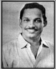
கலாபூசணம் அரங்கம் இரா. தவராஜா

பேச்சுத்துறையில் இராஜதுரை (சென்ற இதழ் தொடர்ச்சி)