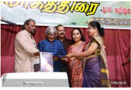
'நமது இருண்ட வானத்துக்கு கொஞ்சமேனும் நட்சத்திரங்கள் தேவையல்லவா'

ஒரு நட்சத்திரம் உதிர்ந்து விழும்போது ஏற்படும் துயரத்தை மகாத்மக்கள் அறியமாட்டார்கள்.'