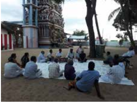
காரைதீவு நிருபர் சகா

கண்ணகி கலை இலக்கியக்கூடலின் 9ஆவது வருட கண்ணகி இலக்கியவிழாவை இம்முறை காரைதீவில் எதிர்வரும் அக்டோபர் மாதம் 18ஆம் 19ஆம் 20ஆம் திகதிகளில் நடத்த திட்டமிடப்பட்டுள்ளது.