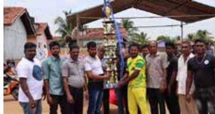
காரைதீவு நிருபர் சகா

RVS கலைக்குழு நடாத்திய "பாண்டிருப்பு 2019" சம்பியன் கிரிக்கெட் சுற்றுப்போட்டியில் காந்தி ஜீ அணி வெற்றிபெற்று வெற்றிக்கிண்ணத்தை தனதாக்கியுள்ளது.