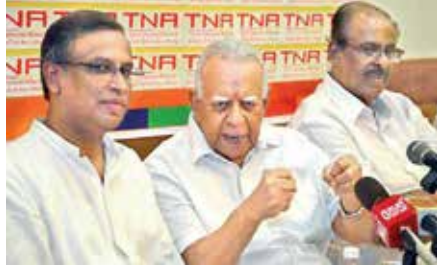
அவர்கள் காரியாலய மட்டத்தில் வழங்கப்படும்

ஒரு சமூகம் அரசியலில் விழிப்பு நிலையடைதல் அந்தச் சமூகத்தின் பல அடிப்படைப் பிரச்சினைகளுக்கு தீர்வாக அமையும். இதனால்தான் மக்களுக்காக உழைக்கும் அரசியல் கட்சிகள் மக்களை அரசியலில் விழிப்பூட்டுவதற்காக பல்வேறு செயற்திட்டங்களை முன்னெடுக்கின்றனர்.