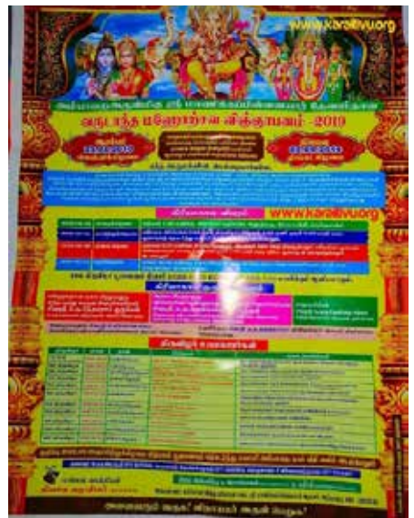
காரைதீவு நிருபர் சகா

பாண்டிருப்பு வடபத்திரகாளியம்பாளர் ஆலய வருடாந்த சக்திப்பெருவிழா எதிர்வரும் 03ஆம் திகதி செவ்வாய்க்கிழமை திருக்கதவு திறத்தலுடன் ஆரம்பமாகின்றது.