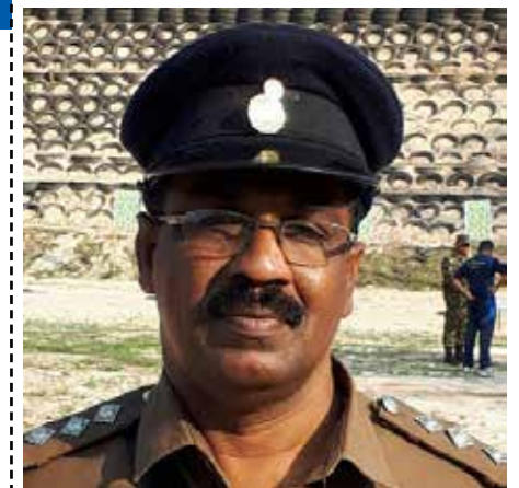
காரைதீவு நிருபர் சகா

போதை ஒழிப்பு வாரத்தை முன்னிட்டு கல்முனை மதுவரி நிலையத்தினர் திடீர்ப்பாய்ச்சலை நடாத்திவருகின்றனர்.