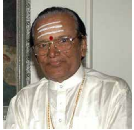
ஊரை வாங்கினால் உலகை வாங்கலாம். [நம் நாடு- 'நல்ல நல்ல பிள்ளைகளை நம்பி ' பாடல்].

அவர் ஒரு கட்டத்தில் தானாக ஒரு பாடல் வரிகளை முணு முணுக்க ஆரம்பித்தார். 'பேரை வாங்கினால் ஊரை வாங்கலாம்..