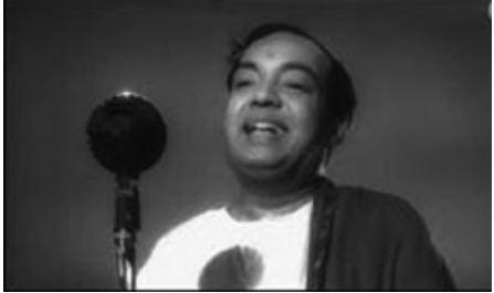
கண்ணதாசனின் உரை தமிழ்மொழி உருவத்தாலும் ஒலியாலும் வேறுபட்டு நின்று நிலவும் பல மொழிகளின்