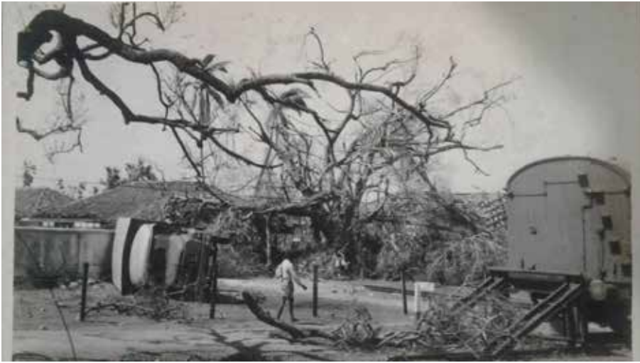
காரைதீவு நிருபர் சகா

1978ஆம் ஆண்டு நவம்பர் மாதம் 23ஆம் திகதி கிழக்கு மாகாணத்தை உலுக்கிய அகோர சூறாவளிக்கு இன்று(23) வெள்ளிக்கிழமை நாற்பது(40) வயதாகின்றது.