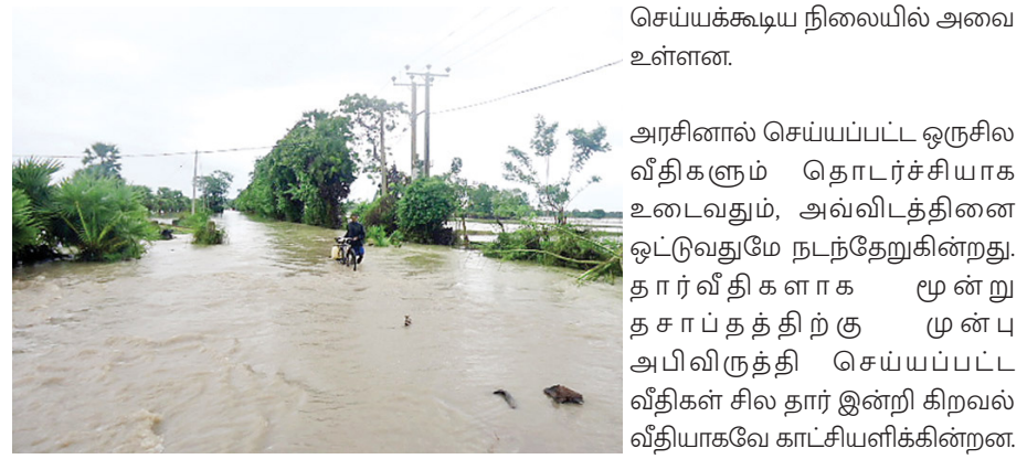
செய்யக்கூடிய நிலையில் அலை உள்ளன.