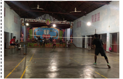
(காரைதீவு நிருபர் சகா)

காரைதீவு விளையாட்டுக்கழகம் தீபாவளி தினத்தை முன்னிட்டு வருடாவருடம் நடாத்திவரும் காரைதீவு விளையாட்டுக்கழக கனிஸ்ட வீரர்களுக்கிடை யிலான மென்பந்து சுற்றுப் போட்டியை காரைதீவு கனகரெட்ணம் விளையாட்டு மைதானத்தில் ஏற்பாடு செய்யப்பட்டிருந்தது.