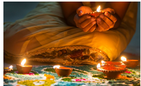
தலைமை விளக்கேற்றுவிழா. ஒருவேளை தலைத்தீபாவளியாக இருக்குமோ?

கிறிஸ்துவுக்குப்பின் ஆறாம் ஏழாம் நூற்றாண்டுகளில் முற்றுப்பெற்றவை என்பது ஆய்வாளர் முடிவு. அதேபோல, ஏழாம் நூற்றாண்டில் வடஇந்தியாவை ஆண்ட ஹர்ஷர் என்ற மன்னரால் எழுதப்பட்ட 'நாகாணந்தம்' எனும் நாடகத்தில் தீபங்கள் ஏற்றப்படுகின்ற, புது மணத்தம்பதியர் பரிசுகளைப் பெற்றுக்கொள்கின்ற, ஒரு பண்டிகை பற்றிய குறிப்புவருகின்றது. அப்பண்டிகையின் பெயர் "தீப்பிரதிப தோற்சவம்" தமிழில்,