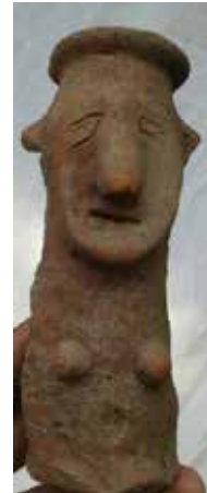
ஆதாரங்களுடன் பதிவு செய்தார்.

என வரையறுக்கப் பட்டுள்ளது. பழங் கற்கால பண்பாட்டில் கற்பாறைகளின் பயன்பாடும் கல்லாயுதங்களும் முக்கியப்பட இடைக்கற்காலம் புதிய கற்காலம் ஆகியவற்றில் வாழ்ந்த மக்களின் வாழ்வியல் முறைகளையும் வெளிப்படுத்துவனவாக பாறை ஓவியங்களும் வேட்டை கருவிகளும் உலகெங்கும் கண்டுபிடிக்கப் பட்டுள்ளன.