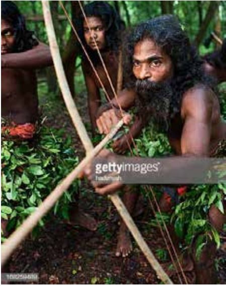
மட்டக்களப்பின் புராதன தெய்வங்களும் வணக்கமும்

மட்டக்களப்பு பகுதியிலே குடியேற்றங்கள் ஏற்பட முன்னர் இங்கு சில சாதியினர் வாழ்ந்தனர் என்பது கர்ண பரம்பரைக் கதைகளாலும், மட்டக்களப்பின் தெய்வ, வணக்க முறைகளாலும் அறியமுடிகிறது.