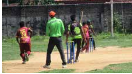
(காரைதீவு நிருபர் சகா)

கல்முனை நியுஸ்டார் விளையாட்டுக் கழகம் வருடாந்தம் நடாத்திவரும் "ஏற்றியன் கிண்ண" மென்பந்துகிரிக்கட் சுற்றுப்போட்டிகல்முனை கிஷா ஸ்டூடியோ ஆதரவில் (14) ஞாயிற்றுக்கிழமை காலை ஆரம்பமாகியது. அணிக்கு 11பேர்கொண்ட இந்த 10ஓவர் மென்பந்துக்கிரிக்கட் சுற்றுப்போட்டியில் 24 கழகங்கள்