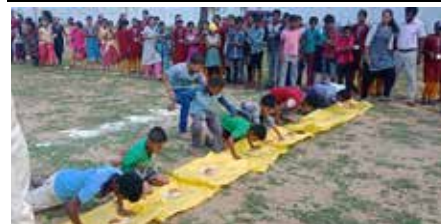
(காரைதீவு நிருபர் சகா)

உலக சிறுவர் தினத்தை முன்னிட்டு காரைதீவு பிரதேச செயலக சிறுவர் பெண்கள் பிரிவின் ஏற்பாட்டில் சிறுவர்களுக்கான விளையாட்டு விழா கழு/ விபுலானந்தா மத்திய கல்லூரி விளையாட்டு மைதானத்தில் 23.10.2018 ம் திகதி, காரைதீவு பிரதேச செயலாளர்