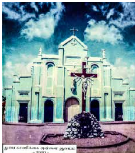
தாய் காணிக்கை அன்னை ஆலயம் - 1902 -

இவ்வாண்டு (2018) தாண்டவன்வெளி திருச்சபை தனிப் பங்காக பிரகடனப்படுத்தப்பட்ட நூறாவது ஆண்டில் கால் பதித்துள்ளது என்பதை பெருமையுடன் நினைவுகூர்வதுடன், இலங்கையின் முதல் புனிதரான புனித ஜோசப்வால் அடிகளார் கால்பதித்த புனித யூரியாகவும் திகழ்கின்றது என்பதில் பெருமையும் அடைகின்றது.