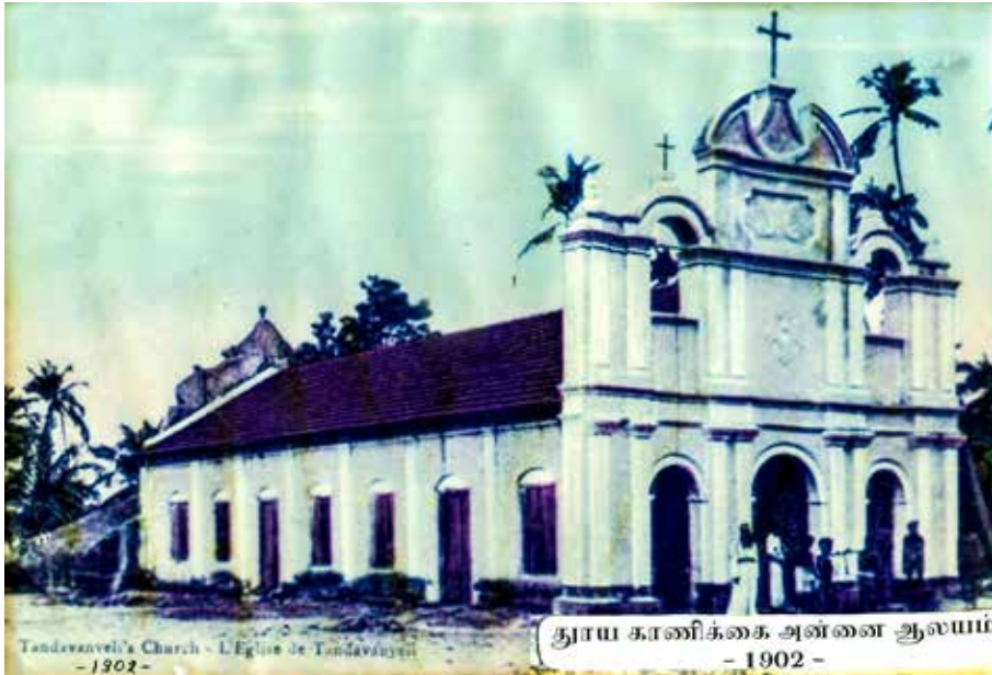
தாய் காணிக்கை அன்னை ஆலயம் - 1902 -

மட்டக்களப்பு நகரிலிருந்து வடக்கே திருமலை வீதியில் ஒரு கிலோமீற்றர் தொலைவில் அமைந்துள்ள தாண்டவன்வெளி, காணிக்கை அன்னை ஆலயம். இவ்வாலயம் ஆரம்பத்தில் புனித வியாகுல மாதா ஆலயம் என அழைக்கப்பட்டு வந்தாலும் தற்போது காணிக்கை அன்னை ஆலயமாக மாற்றம் பெற்றுள்ளது.