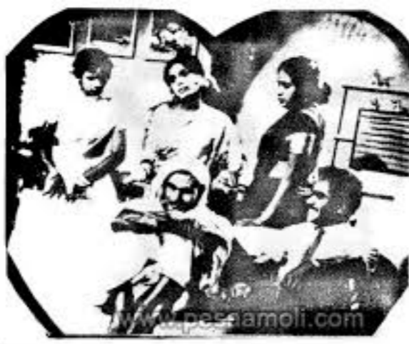
‘மஞ்சள் குந்தம்’ படத்தில் ஒரு நுணுக்கமாக காட்டும் மணிமேகலை, மகனார், இத்தா ரொசாரியா பீரஸ், சீலோன் சிவனையர் ஆகியோர். (1970)

பேலியாகொடையில் பூபால் விநாயகர் ஆலயம், பண்டாரநாயக்கா மாவத்தையில் சிவசுப்பிரமணிய சுவாமி கோயில்,