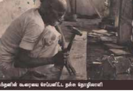
கந்தனின் கூரையை செப்பிட்டு தச்சுத் தொழிலாளி

500-ம் ஆண்டளவில் விஜயன் அமைத்த கோயில் என யாழ்ப்பாண வைபவமாலை, எல்லாள் மன்னனை வெல்வதற்காக துட்டகைமுறு கி.மு 101 கோயில் அமைத்தான் என்று கந்தஉபாத என்ற சிங்கள நூல் என பல்வேறுபட்ட தொன்மக்கதைகள் கதிர்காம முருகன் கோயிலை அமைத்தற்கான காலகோடுகளை