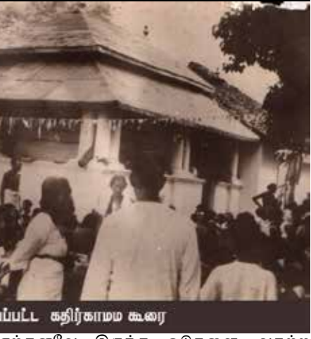
செப்பு தகட்டால் வேயப்பட்ட கதிர்காமம் கூரை

கொழும்பில் இருந்த மட்டக்களப்புக்கு செப்பு தகடுகளை வரவழைத்து அவற்றை சீராக்கி, மட்டக்களப்பில் மரம் அறுத்து தகட்டையும் அதற்குரிய