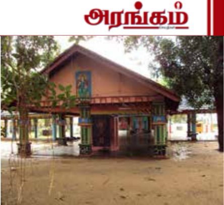
தலைப்பில் இவ்வாறு சொல்கிறார்:

இந்த நூலின் இறுதியில் பிரசாத் சொக்கலிங்கம், “ தேடலில்...” என்னும்