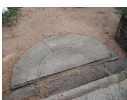
அடையாளங்களில் ஒன்று என்பதை மறுப்பதற்கில்லை.

“வெல்காமே” பின்னர் “வெல்கம்” என மாறியதாக சிலரின் கருத்துக்களும் கவனத்துக்கு உரியதே. ஈழத் தமிழர்களின் வரலாற்றில் இராஜ இராஜப் பெரும் பள்ளி தமிழர்களின்