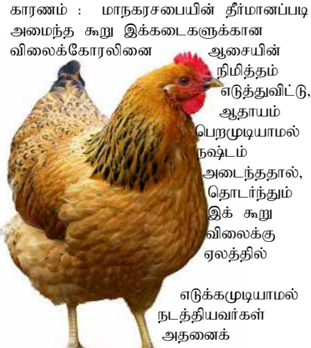
எடுக்கமுடியாமல் நடத்தியவர்கள் அதனைக்

மட்டு மாநகரப் பொதுச் சந்தையில் கடந்த அரை வருடமாக கோழி இறைச்சிக்கடைகள் இரண்டும் முடப்பட்டு இருக்கின்றன.