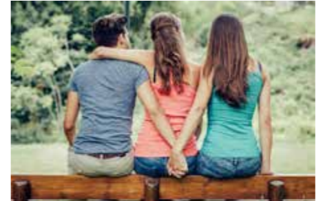
கேட்கிறது. தன் காதலனிடம் சொல்கிறான்

பூத்து மலர்ந்து பூவாசக் கொண்டிருக்கேன் பூத்த மரம் காங்குமென்றால் பூவென்றே கைதருகும்