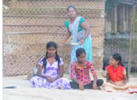
சமூகத்தினருடன் ஆரம்பித்த பூங்காவானது எவ்வித அச்சமுமின்றி நாடு தழுவிய ரீதியில் சிறார்களை மையப்படுத்தி தனது பணியினை முன்னெடுத்து வந்தது. நகடுலேன்

நமது நாடு யுத்த மேகத்தால் குழப்பப்பட்டுந்த காலமான 1996ம் வருடம் புரட்டாதி மாதம் 11ம் திகதி தனது பணியினை தமிழ், சிங்கள, முஸ்லிம்