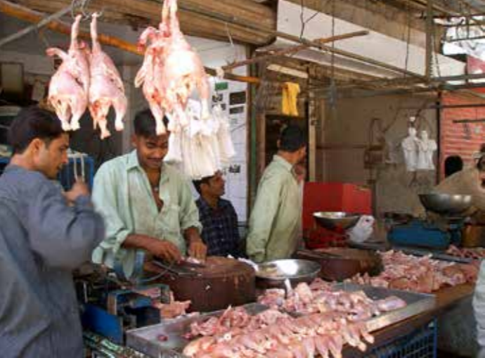
அதேவேளை பொதுச் சந்தையில் மாட்டிறைச்சிக் கடை ஒன்றும் ஆட்டிறைச்சிக் கடையொன்றும் மாத்திரமே இயங்குவதால் பொதுக்களுக்கு இதை விட்டால்

பொதுச் சந்தை காலை எட்டு மணி தொடக்கம் மதியம் பனிரெண்டு மணி வரையும், நாலு மணித்தியாலம் வியாபாரம் நடைபெறும். எல்லை வீதிக்கடைகள் காலை எட்டுமணி தொடக்கம் இரவு எட்டுமணி வரையும் பனிரெண்டு மணித்தியாலங்கள் வியாபாரம் நடைபெறுகின்றது.