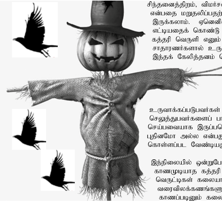
காணப்படும். இது வேறு விடயம். கலை வரலாற்றில், கலை உருவாக்கம் பற்றிய சிந்தனையில் ஒன்றுபோல் மற்றொன்று காணமுடியாத கத்தரிவெருளி எனும் வெருட்டி கவனத்தில் கொள்ளப்படாது போயிருப்பதன் காரணங்கள் வையாகத்தான் இருக்க முடியும்?

கத்தரி வெருளி எனும் வெருட்டி பற்றி பலரும் அறிந்திருப்பர். ஆயினும் இலத்திரனியல் ஊடகங்கள் காட்டும் உலகங்களில் வாழ்ந்திருப்போர் கவனத்தில் கத்தரி வெருளி எனும் வெருட்டி படாமல் போயிருப்பதும் ஆச்சரியமானதல்ல. எனினும் கத்தரி வெருளி எனும் வெருட்டி பேசும் பொருளும் பேசாப் பொருளும் மிகவும் ஆழமானவை.