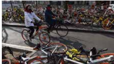
முதன் முதலில் சைக்கிள் பகிரும் திட்டம் அமுலுக்கு வந்தது.

வெள்ளைச் சைக்கிள் திட்டம் என்ற பெயரில் 1960 இல் அம்ஸ்டர்டம் நகரில்தான்